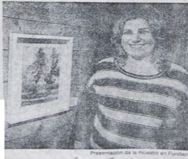
Presentación de la muestra en Fundacruz

MUESTRA TiempoSur redaccion@tempo.com.ar